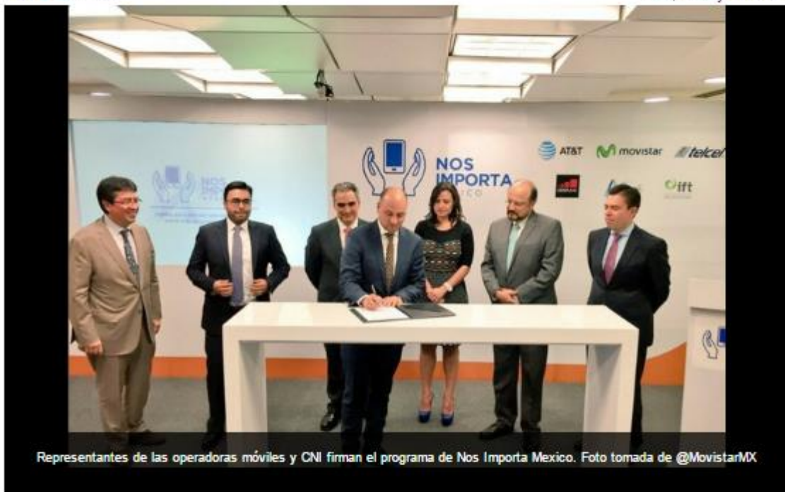
Representantes de las operadoras móviles y CNI firman el programa de Nos Importa México.

Ciudad de México. El número 911 que atenderá todas las llamadas de seguridad y emergencia del país entrará en operación este año, aseguró el director del Centro Nacional de Información Guillermo del Río.