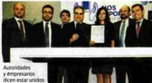
Autoridades y empresarios dicen estar unidos.