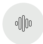
Política de Espectro

Cuatro ejes son los principales para analizar al sector de telecomunicaciones y establecer un hilo conductor con las recomendaciones presentadas en las últimas elecciones por la GSMA 7 , pensando en qué ecosistema se busca alcanzar en Argentina para los próximos años.