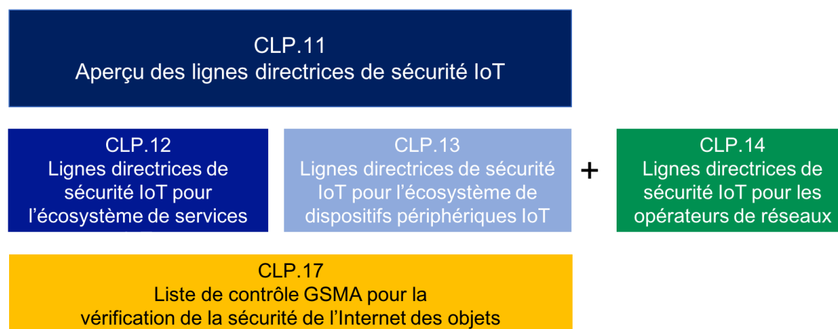
Figure 1- Structure des Documents sur les Directives de Sécurité de la GSMA

Ce document est destiné aux opérateurs de réseau et aux fournisseurs de services IoT. Les lecteurs de ce document peuvent également être intéressés à lire les autres documents sur les lignes directrices de sécurité IoT de la GSMA [11], comme indiqué ci-dessous.